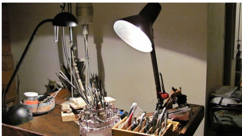
Atelier de Claudine Ginsbourger

La 27 e édition s'accompagnera d'animations diverses (vernissages, concerts, lectures, rencontres...) pendant la durée de l'événement, et permet au public de découvrir les ateliers et des lieux emblématiques du quartier.