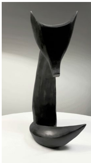
Françoise Baudet, sculpture, Sans titre

Cette année encore au cœur d'un quartier mythique, d'une rue, d'une cour... curieux, amateurs et collectionneurs, sont invités à venir rencontrer les 35 artistes et découvrir des lieux de création atypiques et surprenants. A chacun son itinéraire, son parcours, ses découvertes.