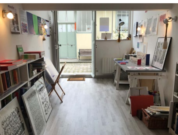
Atelier de Christophe Badani

La 27 e édition s'accompagnera d'animations diverses (vernissages, concerts, lectures, rencontres...) pendant la durée de l'événement, et permet au public de découvrir les ateliers et des lieux emblématiques du quartier.