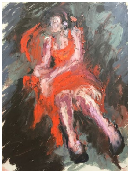
Bénédicte Lescure, peinture